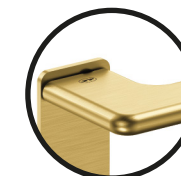
.TG TITANIUM GOLD

T. (+351) 224 663 230 / F. (+351) 224 839 841 / e-mail - jnf@jnf.pt / www.jnf.pt