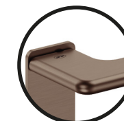
.TCH TITANIUM CHOCOLATE