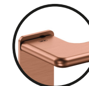
.TCO TITANIUM COPPER