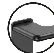
.TB TITANIUM BLACK

Outros acabamentos/ Other finishes/ Otros acabados