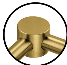
.TG TITANIUM GOLD