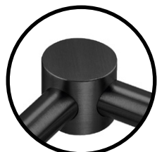
.TB TITANIUM BLACK