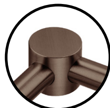
.TCH TITANIUM CHOCOLATE